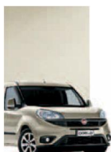
261 - PERLA