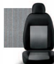
PIN STRIPE GRIGIO 223