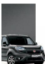
695 - GRIGIO