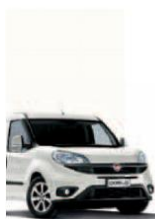
249 - BIANCO

Фарбування кузова пастельною фарбою білого кольору