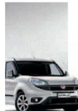
612 - GRIGIO CHIARO