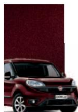
590 - BORDEAUX