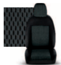
STAR GRIGIO 213