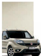
261 - PERLA