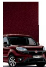
590 - BORDEAUX