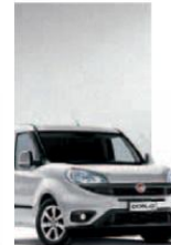
612 - GRIGIO CHIARO