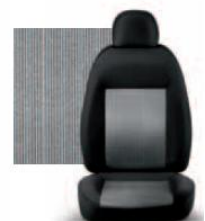
PIN STRIPE GRIGIO 223