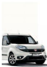
249 - BIANCO