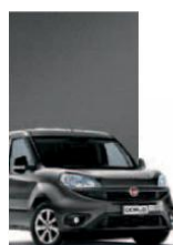
695 - GRIGIO