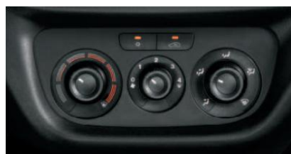
Кондиціонер з ручним регулюванням