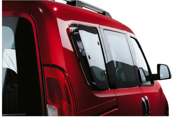
Задні вікна (3-й ряд) відкриваються (кватирки)