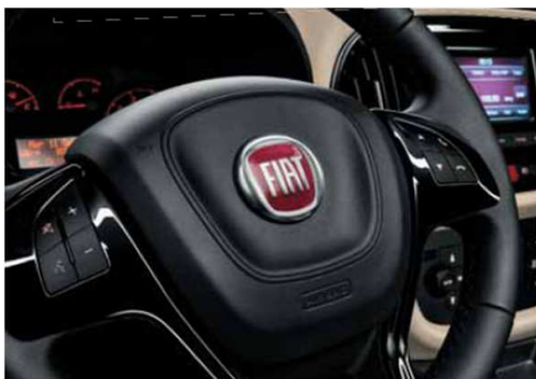
Управління функціями радіо на кермовому колесі