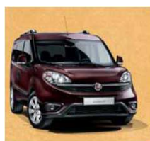
590 - BORDEAUX