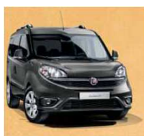
695 - GRIGIO