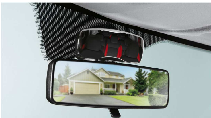
Дзеркало для спостереження за дитиною в салоні (панорамне)