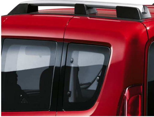
Поздовжні дуги для багажу (рейлинги) на даху