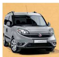
612 - GRIGIO CHIARO