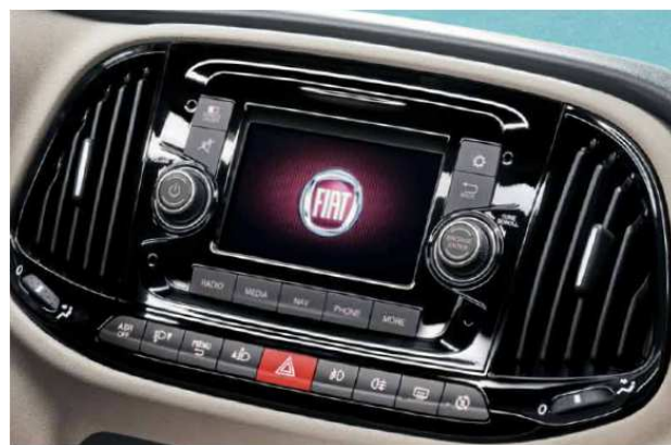
5 "кольоровий сенсорний екран, радіо с MP3, AUX-IN / USB, система Uconnect з Bluetooth®